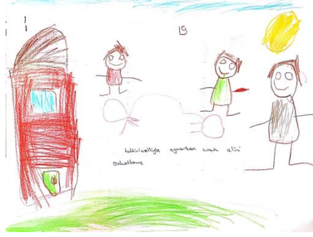
Figür 2: Çocuk resimlerinde oyun oynarken riskli görülen durum olarak çocuk parkındaki yaralanmaya ait resim