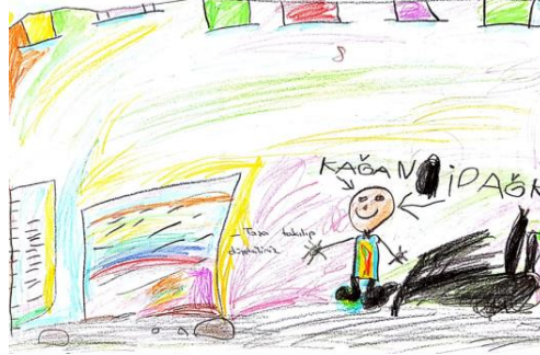
Figür 3: Çocuk resimlerinde oyun oynarken riskli görülen durumlardan okul bahçesinde taşa takılıp düşme anına ait resim