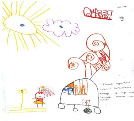
Figür 4: Çocuk resimlerinde oyun oynarken riskli görülen durumlarda trafik kazalarına (açık alan) ait resim