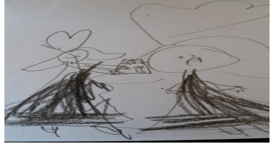
Şekil-8. E., 5 Yaş