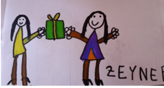
Şekil-7. Z., 5 Yaş