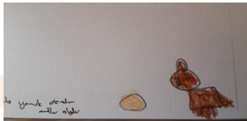
Şekil-12. D., 5 Yaş (Yemek verdim, mutlu oldu)