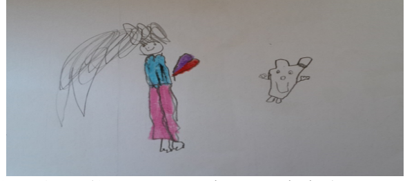
Şekil-2. D, 4 Yaş (Anneme oyuncak tavşan alırdım)