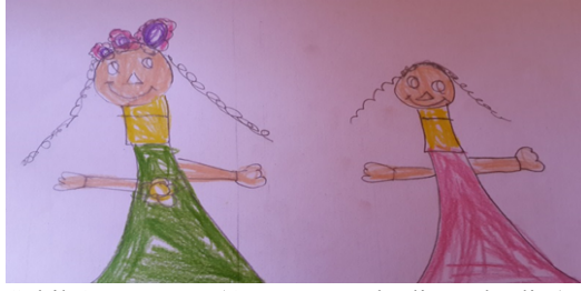
Şekil-1. E, 5 Yaş (Anneme taç hediye ederdim)