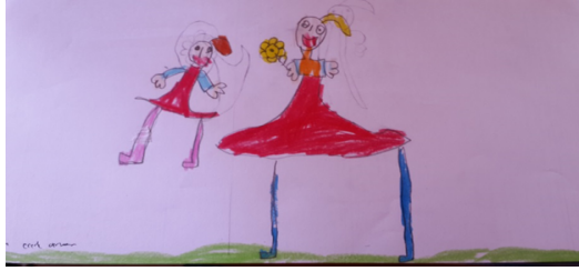
Şekil-3. B, 5 Yaş (Çiçek alırdım)