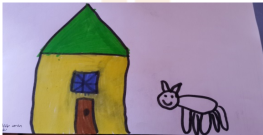
Şekil-10. Z., 5 Yaş (Ona kulübe yaparım)

Bu temalar “İlgi göstermek”, “Hediye vermek” ve “Oyun oynamak” temalarıdır. “İlgi göstermek” teması çocukların kedilerini üzgün gördüklerinde en fazla yapacaklarını belirttikleri görüşleri oluşturan tema olmuştur (%65). “İlgi göstermek” temasının iki alt teması “Yardım etmek” ve “Şefkat göstermek” tir. Çocukların büyük bir çoğunluğu (%86) kediye yardım edeceklerini, ona “su, süt, yemek, ev, kulübe, kedi maması...” gibi şeyler vererek bir ihtiyacını gidereceklerini, doktora götüreceklerini, ameliyat edip kalbine bakacaklarını belirtmişlerdir. Bazı çocuklar (%14) ise kedi sevmek ve okşamak gibi şefkat davranışları göstereceklerini belirtmişlerdir. Hayvanların ihtiyacını giderecek bir yardımda bulunmanın çocuklar tarafından onları mutlu eden bir eylem olarak görüldüğü söylenebilir. Myers, Saunders ve Garnett (2004) yaptıkları çalışmada, çocuklara kabataslak çizilen bir hayvan resmi çizilerek gösterilerek bu hayvanın mutlu olmadığı, neye ihtiyacı olduğu ve ne ile mutlu olabileceği sorulmuştur. Çocukların büyük çoğunluğu (%44), yiyecek, su, dinlenme, hava gibi fiziksel ihtiyaçları çizerek ifade etmişlerdir. Çocukların üzgün olan kedilerini mutlu etmede ikinci olarak kullandıkları yöntem “hediye vermek” olmuştur (%29). Çocuklar kedilerine “top, ip, oyuncak...” gibi hediyeler vererek onu mutlu edeceklerini belirtmişlerdir. Bu bölümdeki son tema ise “Oyun oynamak” tır (%6). Çocuklar üzgün olan kedileriyle oyun oynayarak onu mutlu edeceklerini belirtmişlerdir (şekil 10-11-12).