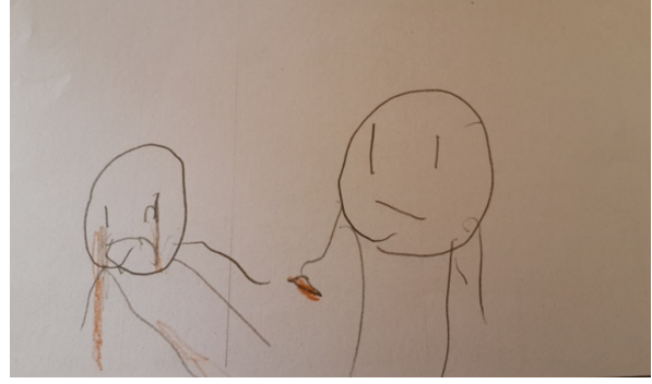
Şekil-6. B., 5 Yaş (Anneme yara bandı verirdim)

İlgi göstermek temasının altında yer alan diğer üç alt tema “yardım etmek” (%24), “sempati göstermek” (%24) ve “teselli etmek” (%24)’tir. “Yardım etmek” alt temasının altında yer alan çocuklar annelerine “yara bandı” vereceklerini veya ona ev işlerinde yardım edeceklerini belirtmişlerdir. Üçüncü alt tema “sempati göstermek” tir. Bu grupta yer alan çocuklar annelerini üzgün gördüklerinde ne yapacaklarına yönelik “ben de ağlarım” şeklinde yanıtlar vermişlerdir. Bir kişiye sempati duymak, o kişinin sahip olduğu duyguların aynısına sahip olmak şeklinde tanımlanmaktadır (Dökmen, 2013). Sempati gösteren kişi karşısındaki acı çekiyorsa acı çeker ve seviniyorsa sevinir. Empati insanın karşısındaki bireyin duygularını anlamasına, sempati ise karşısındaki kişinin duygularının aynısını sorgulamadan hissetmektir şeklinde örneklendirilmiştir. Bu bölümdeki son alt tema ise “teselli etmek” davranışıdır. Çocuklar üzgün olan annelerine “üzülme canım annecim”, “annecim üzgün olma” diyeceklerini belirtmişlerdir.