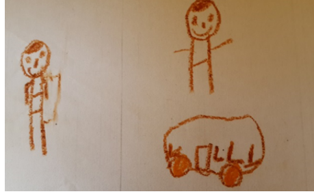
Şekil-9. U., 5 Yaş