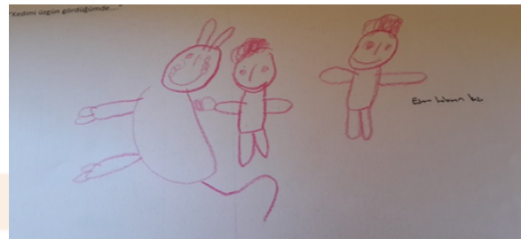
Şekil-11. İ., 5 Yaş (Kalbine bakarım, doktora götürürüm)