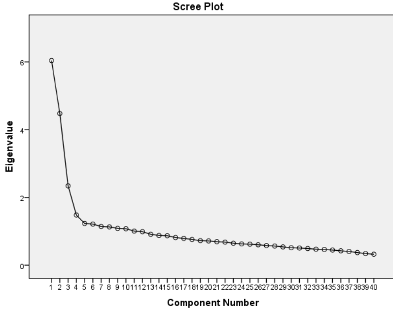
Şekil 1. ÇOYGÖ Faktörleri Öz Değerlerine Ait Saçılma Diyagramı.

Şekil 1 incelendiğinde, ÇOYGÖ için öz değeri diğer faktörlerden daha yüksek olan ve açıkladığı varyansı daha yüksek olan üç faktörün baskın olduğu anlaşılmaktadır. Bu aşamadan sonra, ölçeğin faktör yapısının daha iyi anlaşılabilmesi için döndürme yöntemlerinden varimax (dikey) döndürme kullanılmıştır. AFA için maddelerin yer aldıkları faktördeki yük değerleri için sınır değer .30 olarak alınmış, faktör yük değeri .30'un altında olan 19 madde (2, 4, 10, 12, 14, 18, 22, 25, 26, 30, 33, 37, 41, 43, 44, 46, 54, 58, 59.maddeler) ölçekten çıkarılmıştır. Nihai analiz sonunda ÇOYGÖ AFA bulguları Tablo 2'de verilmiştir.